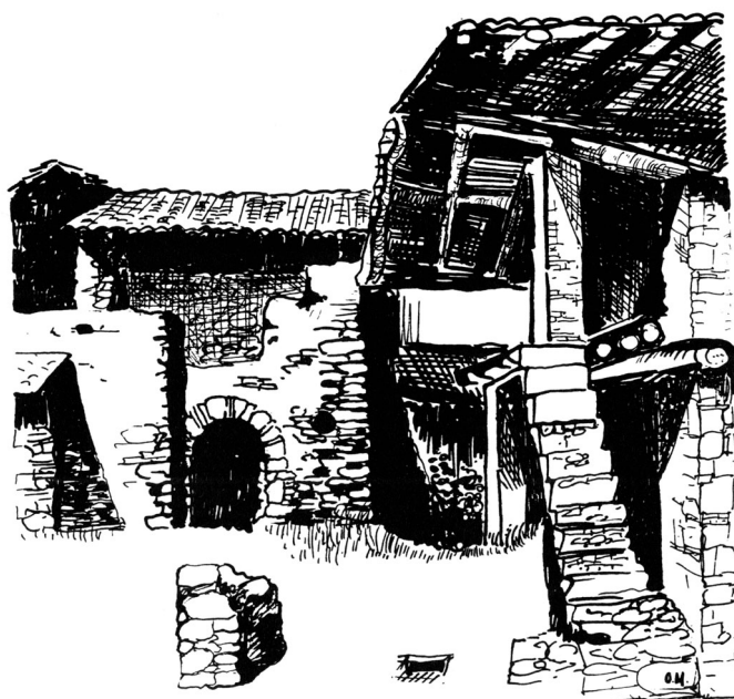
A sinistra alcuni "tegoloni" ("copon") ritrovati da Giovanni Vassalli; sopra un disegno delle fornaci di Onorino Malacrida (da "Riva San Vitale", di Franco Macchi, 1989).

Le fornaci si trovano inserite nella scheda relativa a Riva San Vitale dell'ISOS, l'Inventario federale degli insediamenti svizzeri da proteggere d'importanza nazionale, con la raccomandazione di valorizzarle.