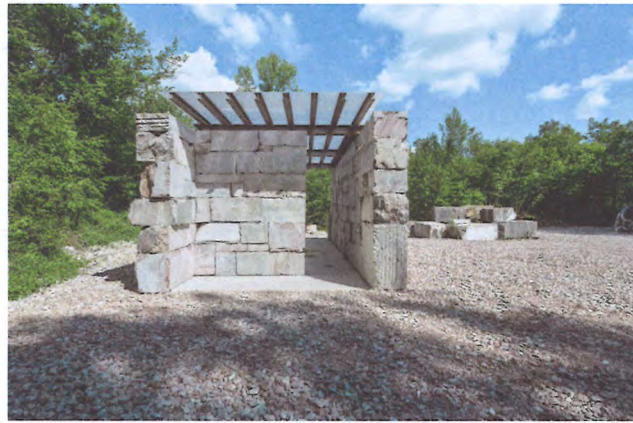
Marmorblöcke sind zu einem Pavillon aufeinandergeschichtet.