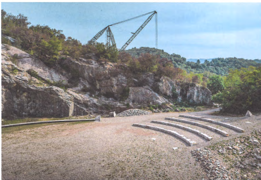
Mit wenigen Eingriffen der Steinbruch in Arzo zum Amphitheater.