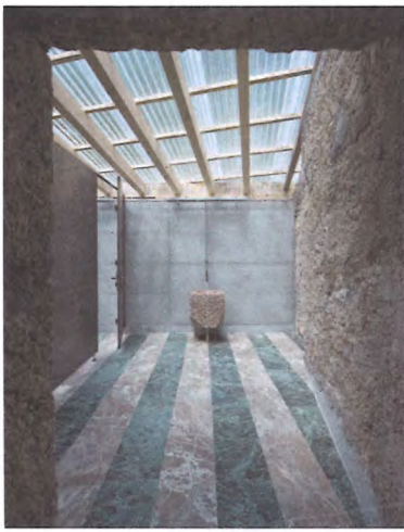
Bodenplatten und Objekte im «Laboratorio» zeigen die Vielfalt des Marmors aus Arzo.